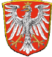
(A) Frankfurt am Main