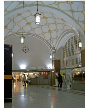
(B) Bahnhof / Centralstation