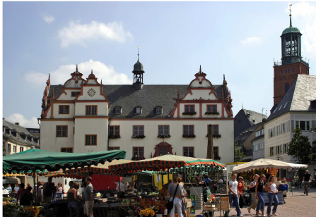
(B) Altes Rathaus