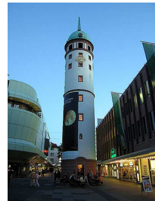
(B) Weißer Turm