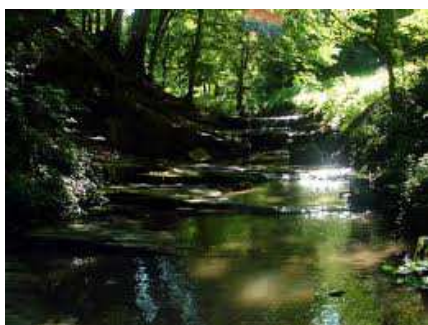
Óbánya 16 km-re található Bonyhádtól