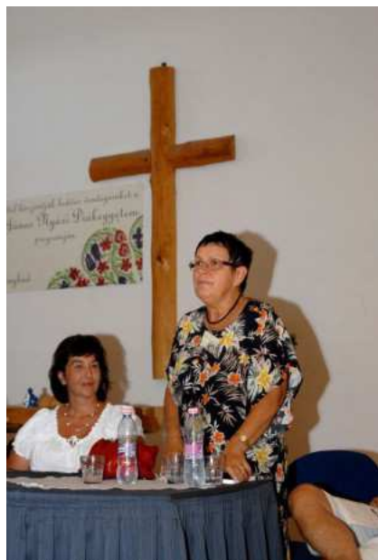
A tábor fővédnökének beszéde

Lotz János világhírű nyelvész, a filozófiai nyelvészet úttörője és nagyhatású képviselője a világban. Célunk egyrészt az ő szellemi hagyatékának megismertetése, másrészt a retorikával, az újságírással, a riporter munkával, a fotózással, a szerkesztéssel szívesen foglalkozó diákok továbbképzése és tapasztalatcseréje. Továbbá az is, hogy a világ bármely pontján élő és a magyar nyelv iránt érdeklődő fiatalok találkozzanak és ismerkedjenek programunkon.